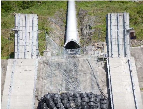
捕捉誘導後の全景