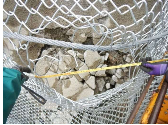
重錘衝突部の損傷状況