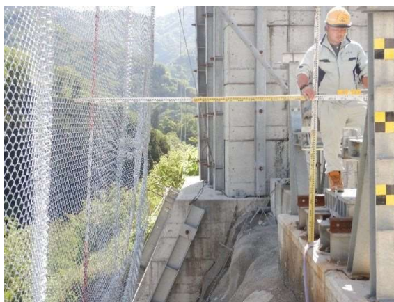
重錘衝突位置確認