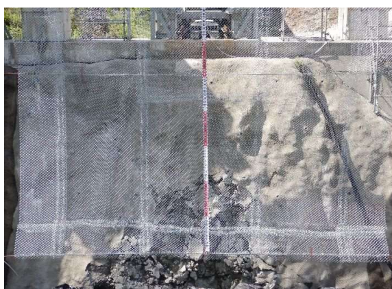
阻止面下端補修状況