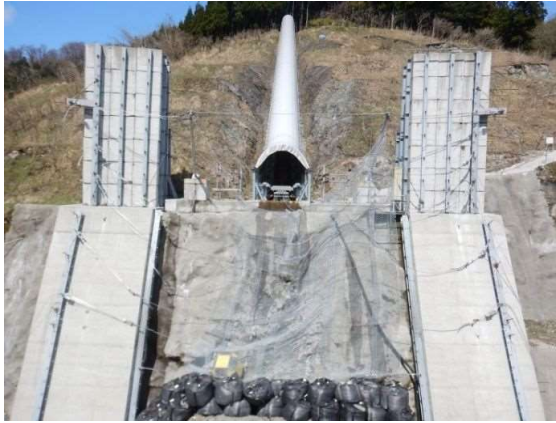
捕捉誘導後の全景