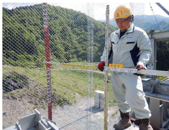
重錘衝突位置確認