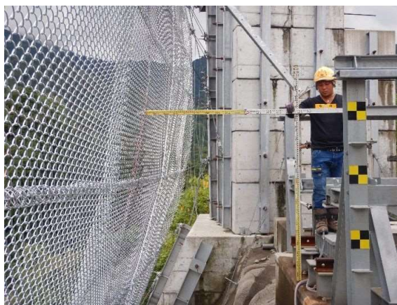
重錘衝突位置確認