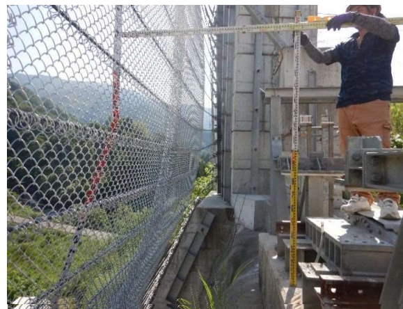
重錘衝突位置確認