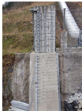
緩衝装置設置状況