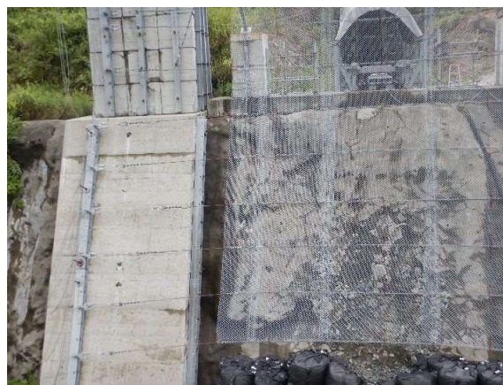
高強度金網修復部