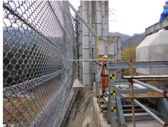
重錘衝突位置確認