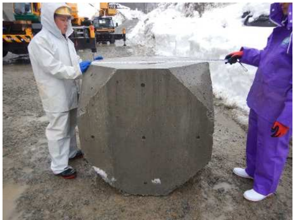
重錘形状寸法確認