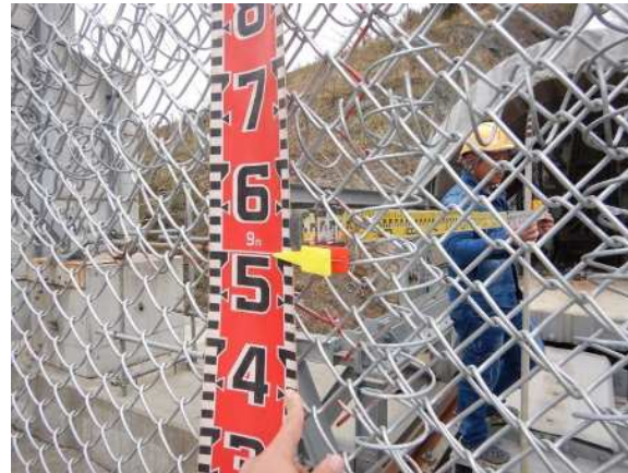
重錘衝突位置確認