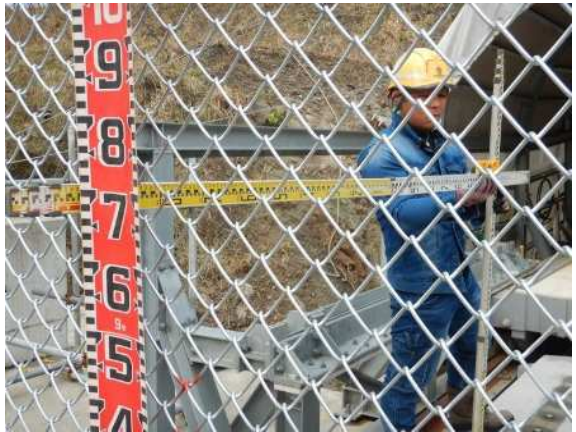
緩衝装置設置状況