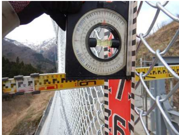
金網端部加工状況