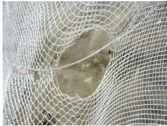
重錘衝突部の損傷状況