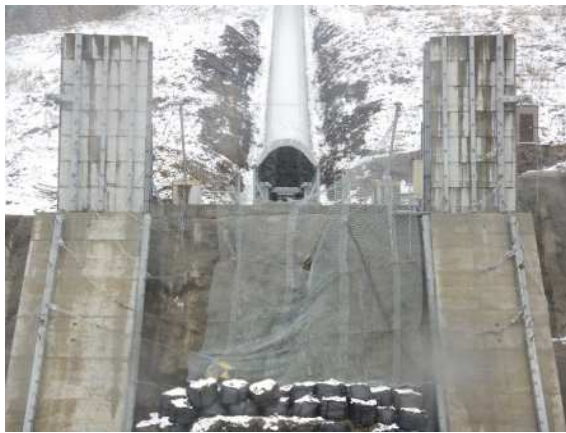
捕捉誘導後の全景