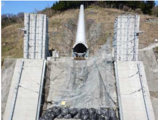
捕捉誘導後の全景