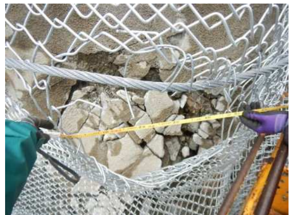
重錘衝突部の損傷状況