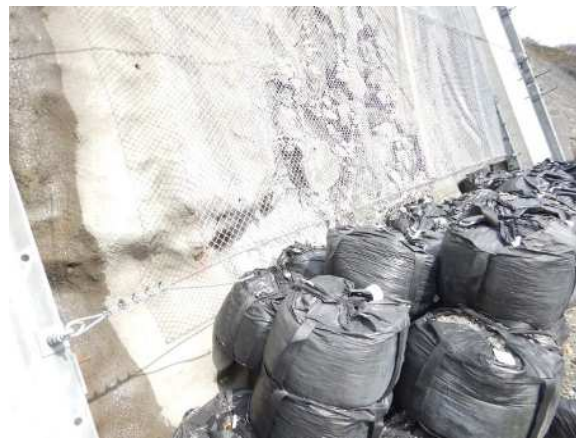
衝突位置確認状況