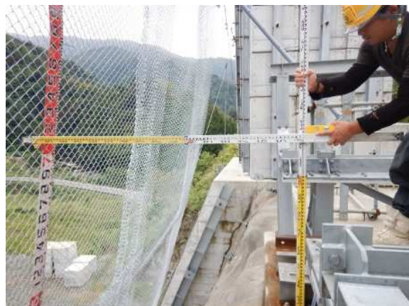
重錘衝突位置確認