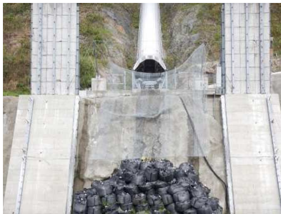
捕捉誘導後の全景