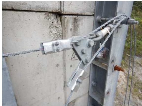
緩衝装置設置状況