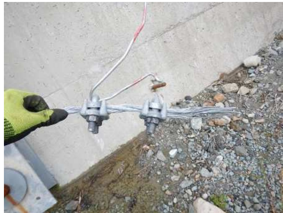
下端ロープ破断状況