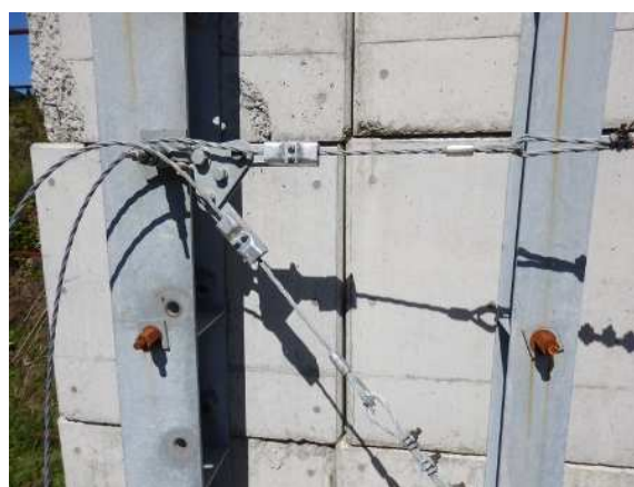
緩衝装置設置状況