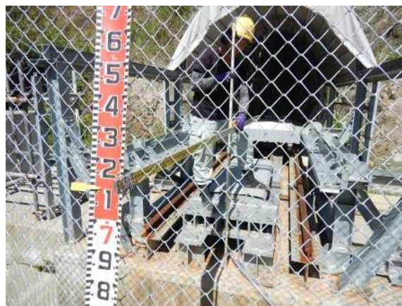
重錘衝突位置確認