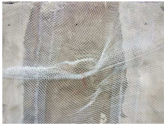
重錘衝突部の損傷状況