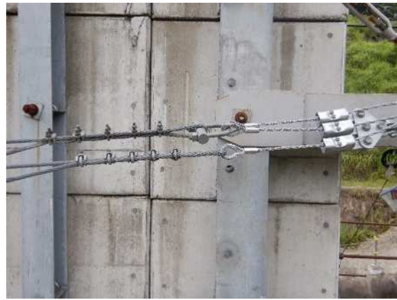
緩衝装置設置状況