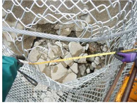
重錘衝突部の損傷状況