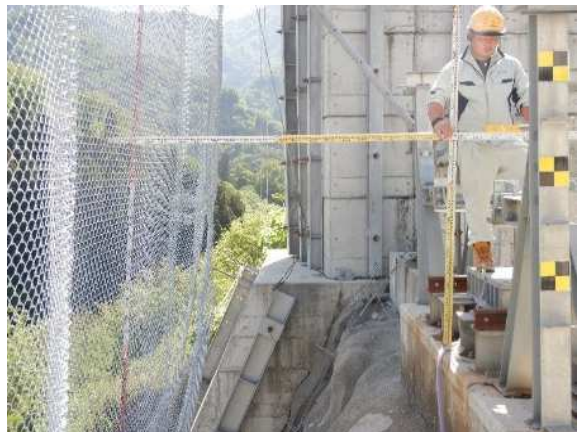
重錘衝突位置確認