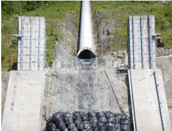
捕捉誘導後の全景