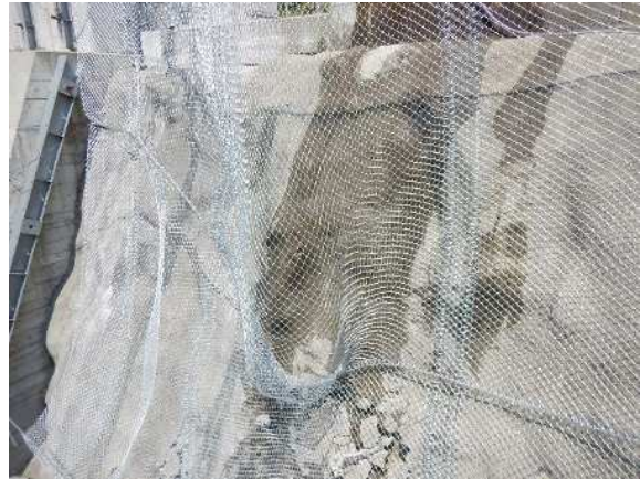
重錘衝突部の損傷状況