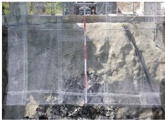
阻止面下端補修状況