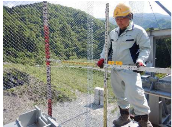
重錘衝突位置確認