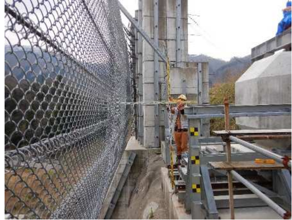
重錘衝突位置確認