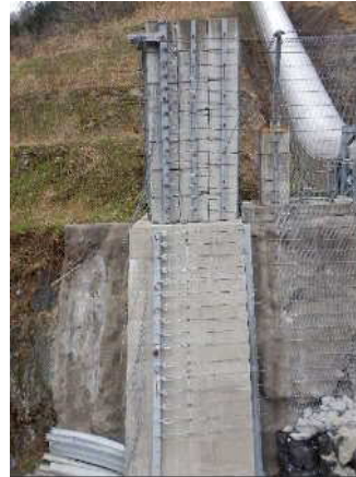
緩衝装置設置状況