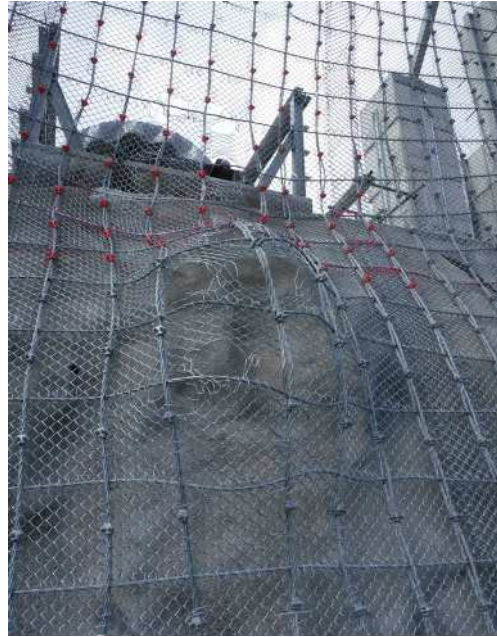
重錘衝突部の損傷状況