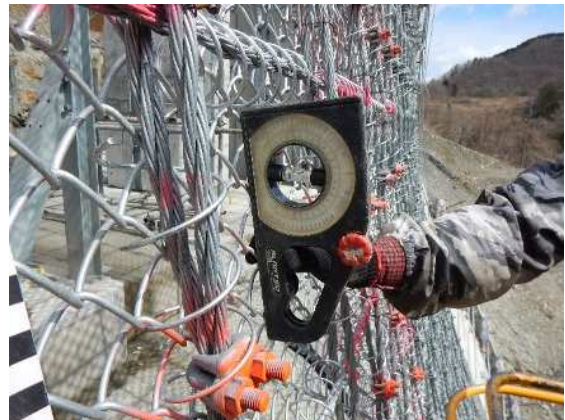
重錘設置角度確認