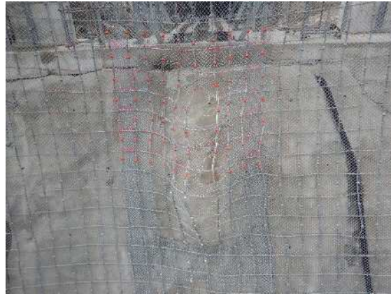
重錘衝突部の損傷状況