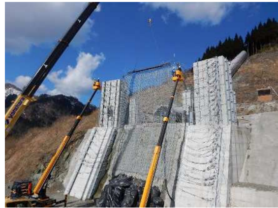
阻止面上端引上げ作業状況