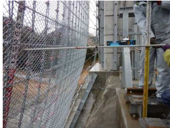
衝突位置確認状況