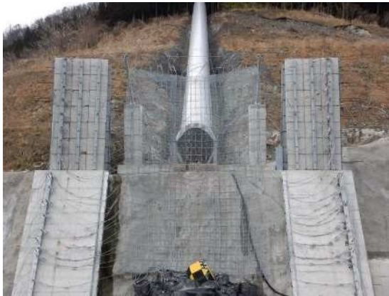
捕捉誘導後の全景