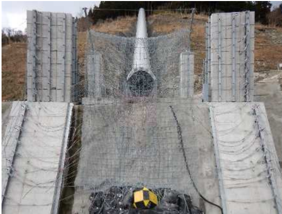
捕捉誘導後の全景