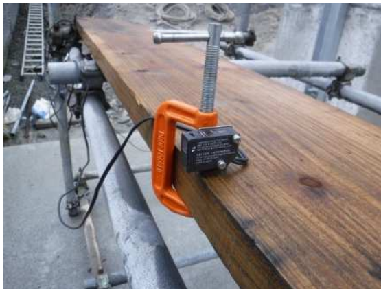
重錘速度計測用レーザー