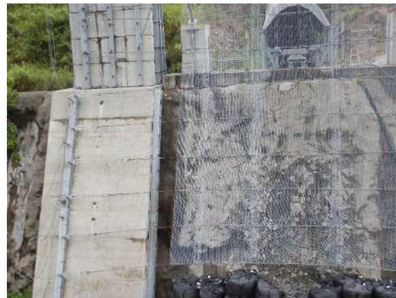
高強度金網修復部