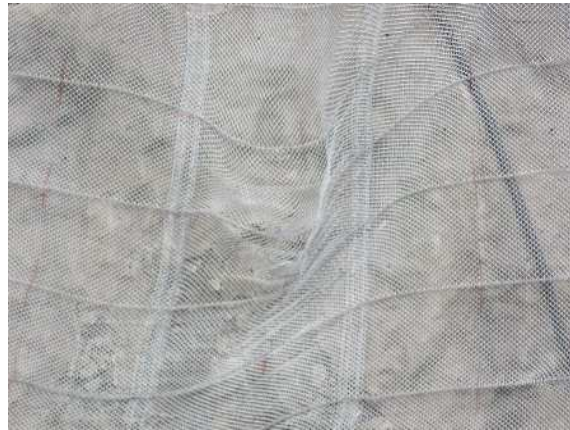
重錘衝突部の損傷状況