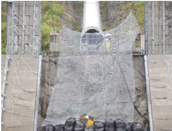
捕捉誘導後の全景