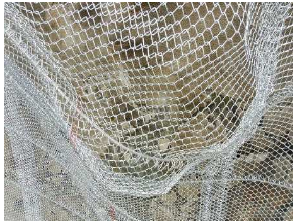
重錘衝突部の損傷状況