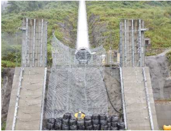
捕捉誘導後の全景