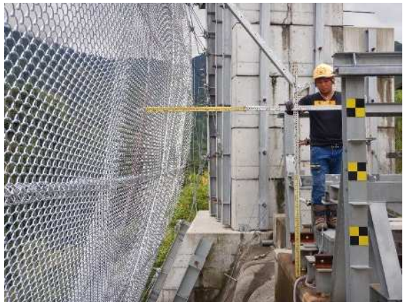
重錘衝突位置確認