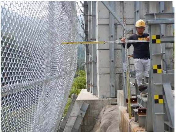
重錘衝突位置確認