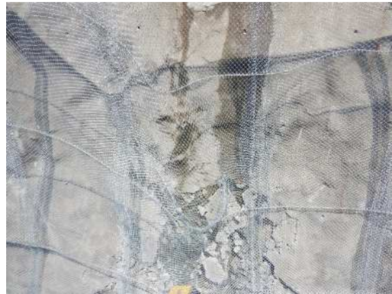
重錘衝突部の損傷状況