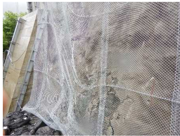
重錘衝突部の損傷状況