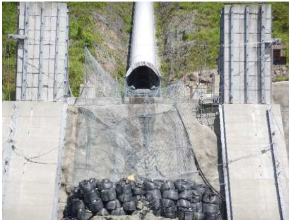
捕捉誘導後の全景