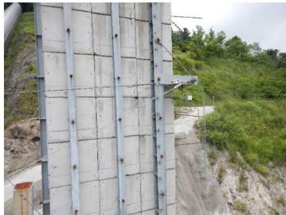
緩衝装置配置状況