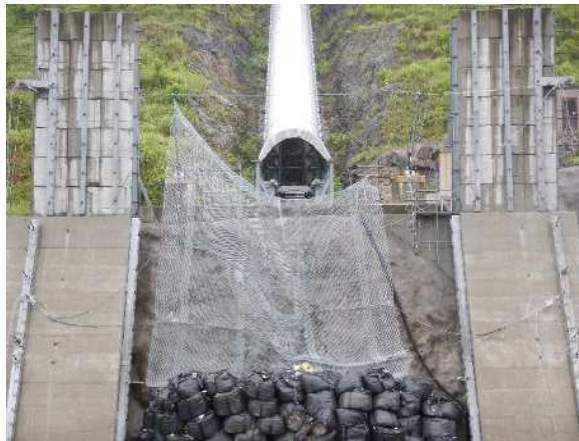
捕捉誘導後の全景