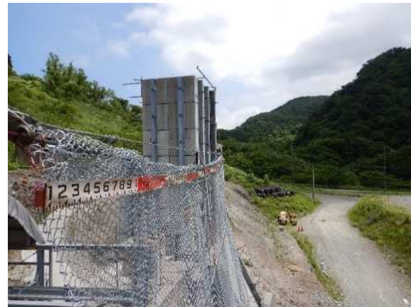
阻止面上端復旧状況