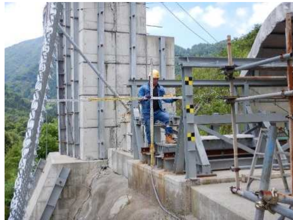
重錘衝突位置確認