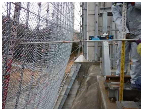
衝突位置確認状況