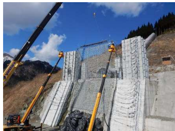
阻止面上端引上げ作業状況