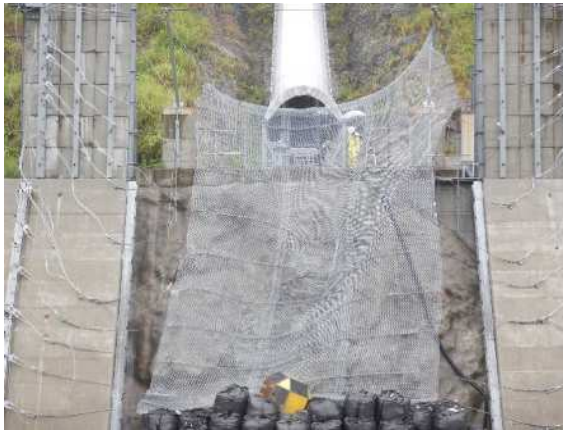
捕捉誘導後の全景