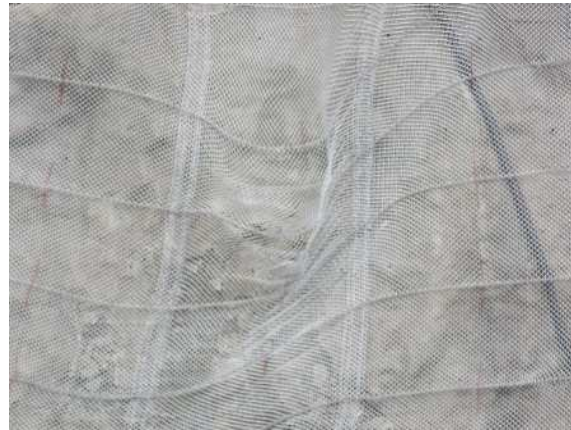
重錘衝突部の損傷状況