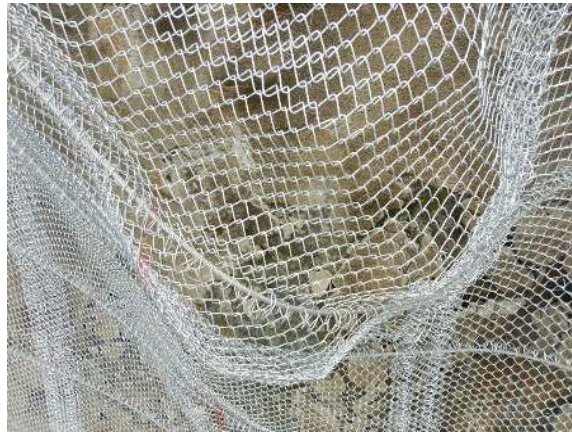
重錘衝突部の損傷状況