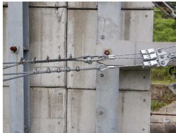
緩衝装置設置状況