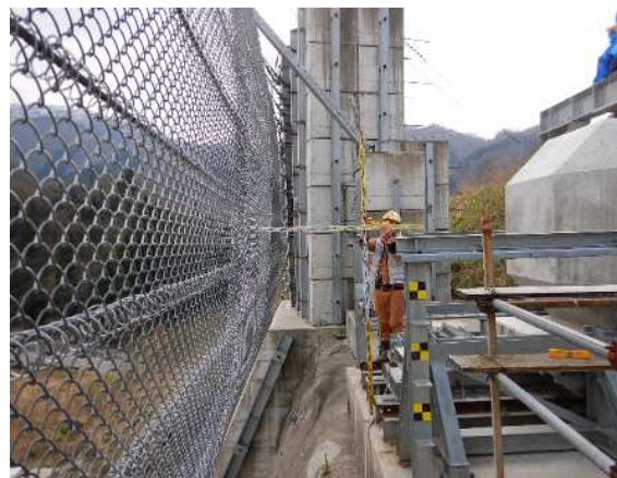
重錘衝突位置確認