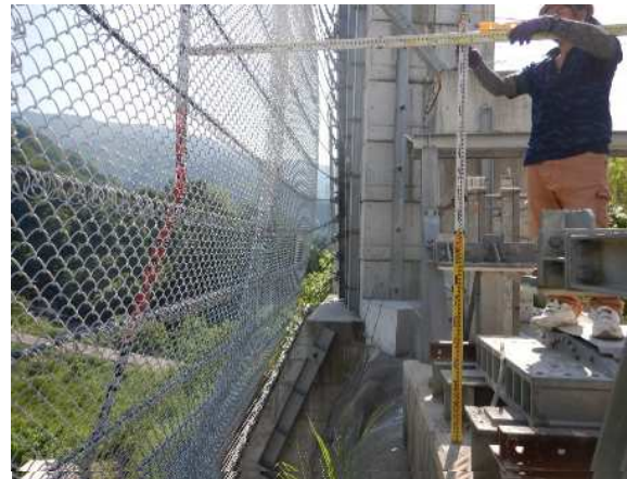
重錘衝突位置確認