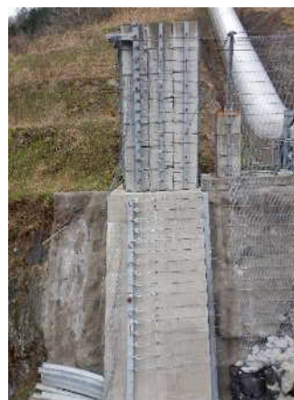
緩衝装置設置状況