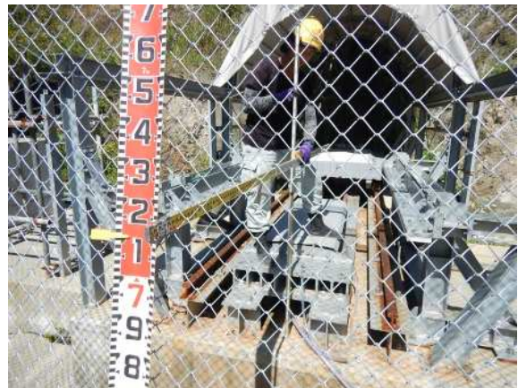
重錘衝突位置確認