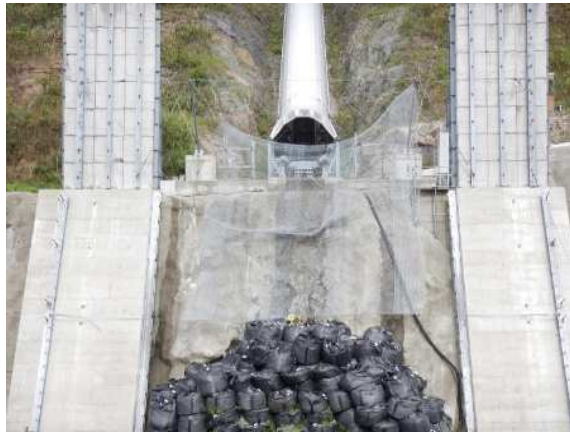
捕捉誘導後の全景