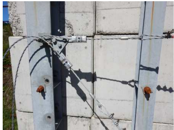
緩衝装置設置状況