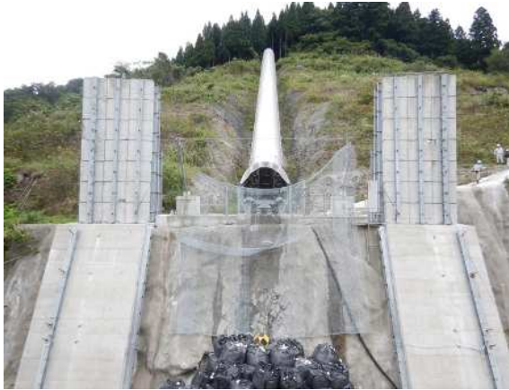
捕捉誘導後の全景