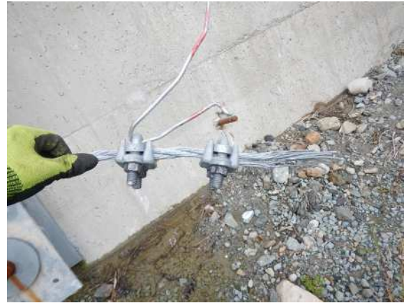
下端ロープ破断状況