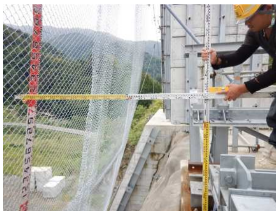
重錘衝突位置確認