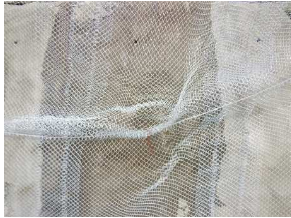
重錘衝突部の損傷状況