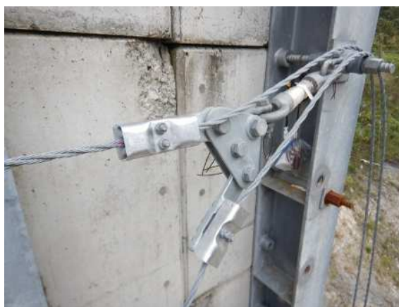
緩衝装置設置状況