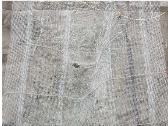
重錘衝突部の損傷状況