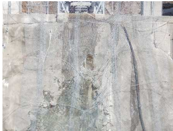
重錘衝突部の損傷状況