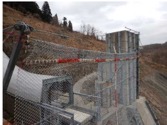
阻止面上端復旧状況