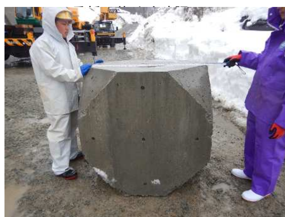
重錘形状寸法確認