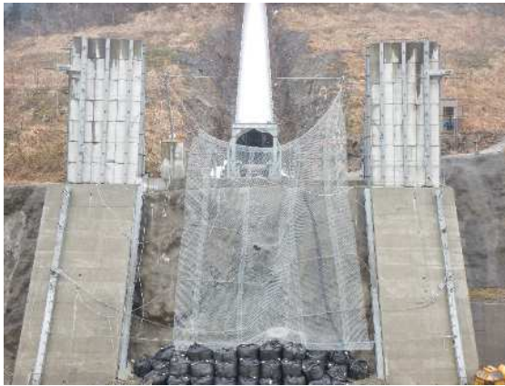
捕捉誘導後の全景