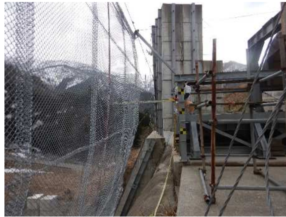
重錘衝突位置確認