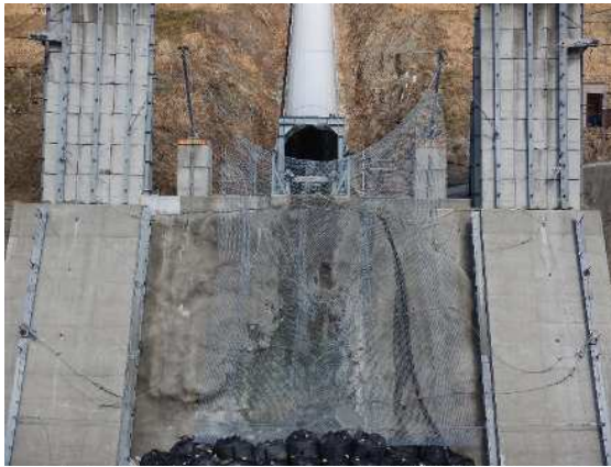
捕捉誘導後の全景