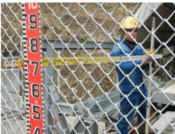
緩衝装置設置状況