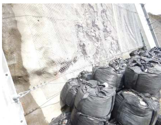
衝突位置確認状況