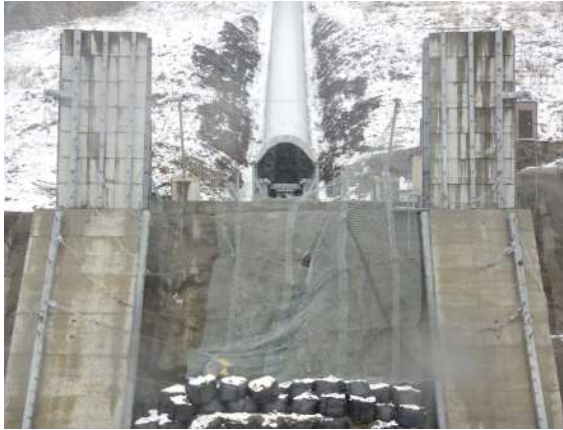
捕捉誘導後の全景