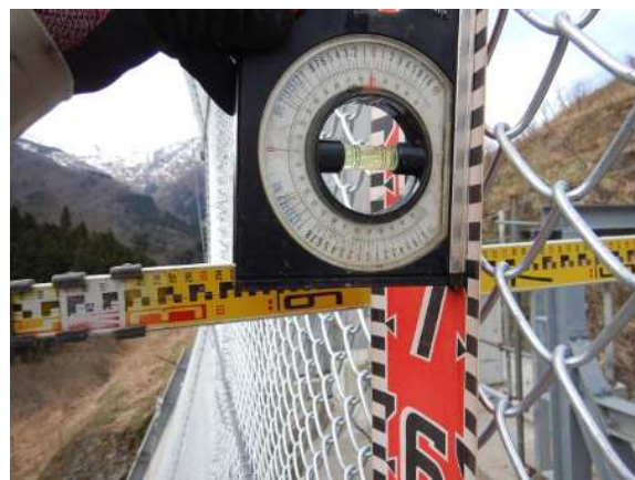
金網端部加工状況