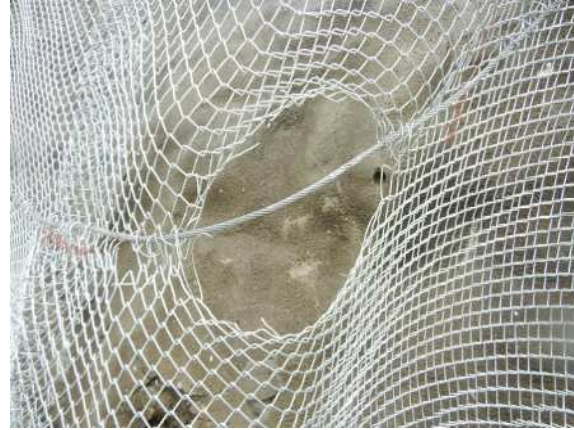
重錘衝突部の損傷状況