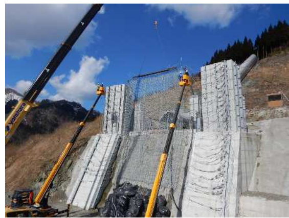
阻止面上端引上げ作業状況