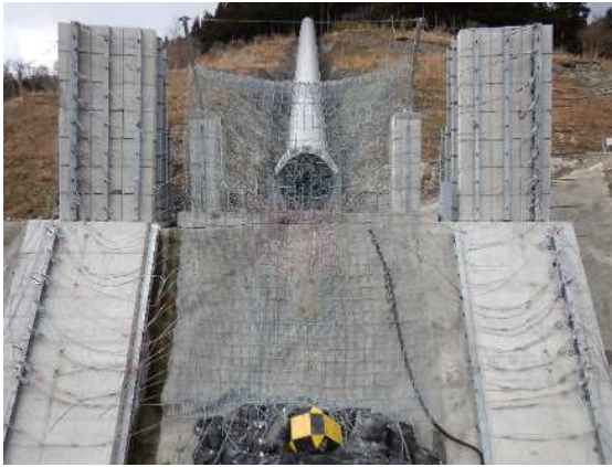
捕捉誘導後の全景