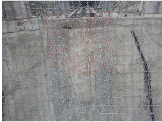
重錘衝突部の損傷状況