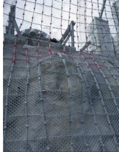
重錘衝突部の損傷状況