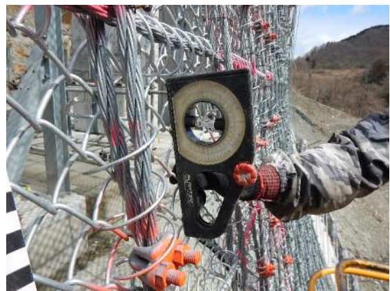
重錘設置角度確認