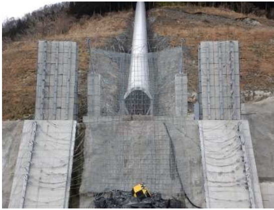
捕捉誘導後の全景